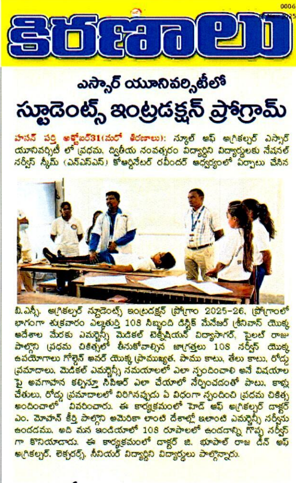
Caption: “Minutes Matter—Learn First Aid & CPR.”“Because Every Life is Precious.”